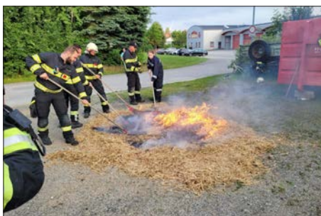
20.07.2021 Übung zu Thema Flurbrandbekämpfung