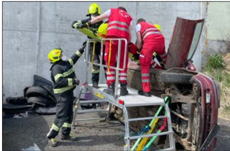
10.04.2021 Ausbildungsnachmittag für Notfallsanitäter

Ohne regelmäßige Übungen könnten die vielen Aufgaben der Freiwilligen Feuerwehr Waidhofen/Thaya nicht so rasch und professionell gelöst werden. Bei 62 Übungen im Jahr 2021 wurden von den Feuerwehrmitgliedern 1.050 Stunden in die Weiterbildung und Festigung ihres Wissens investiert. Hier einige Übungen die im Jahr 2021 absolviert wurden: