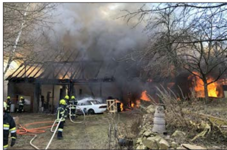
12.03.2021 Großbrand in Kainraths erfordert elf Feuerwehren