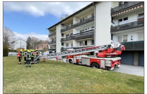
02.04.2021 Personenrettung über Drehleiter