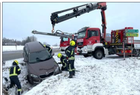
04.12.2021 Ausweichmanöver endete im Straßengraben