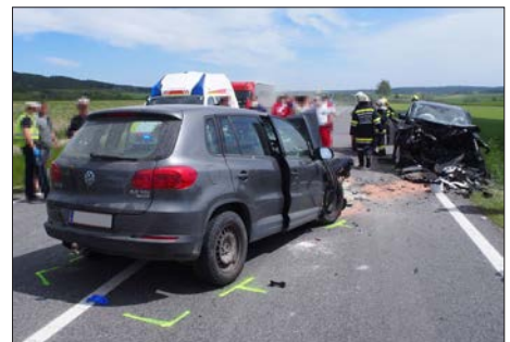
02.06.2021 Frontalzusammenstoß fordert Todesopfer