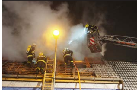
09.02.2021 Dachstuhlbrand im Tierheim in Gastern