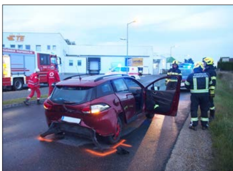
26.08.2021 Lenkerin nach Auffahrunfall in PKW eingeschlossen