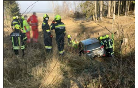
01.03.2021 Drei Verletzte nach Unfall am Bründlberg