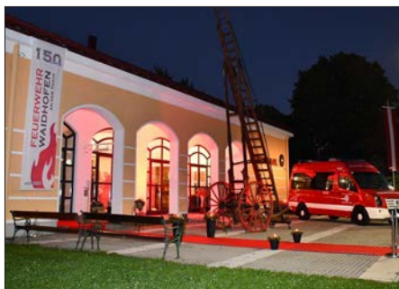
Stadtsaal im Zeichen der Feuerwehr

Am 9. Oktober 2021 wurde der Festakt anlässlich "150 Jahre Feuerwehr Waidhofen" im Stadtsaal abgehalten. Andy Marek führte durch das Programm und konnte eine Vielzahl an Ehrengästen begrüßen.