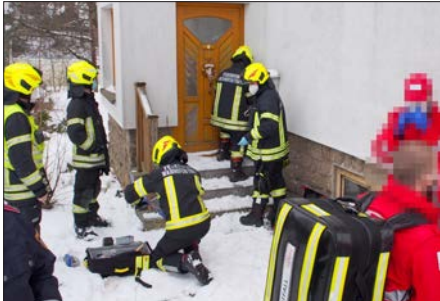
15.01.2021 Medizinischer Notfall erfordert Türöffnung

193 Einsätze wurden im Jahr 2021 von den Mitgliedern der Freiwilligen Feuerwehr Waidhofen/Thaya bewältigt. Egal zu welcher Tages- oder Nachtzeit - die Einsatzkräfte rückten aus und konnten rasch helfen. Insgesamt wurden 1.583 Einsatzstunden von den Mitgliedern geleistet. Hier ein Auszug aus dem Einsatztagebuch der Feuerwehr: