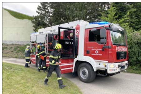
15.06.2021 Übungsintensiver Feuerwehraubend