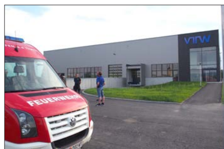
29.06.2021 Begehung des neuen Firmensitzes der Fa. VTW GmbH