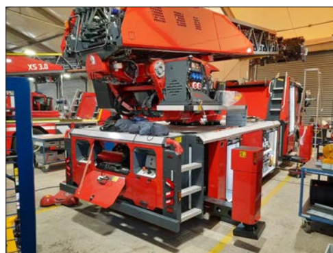
Stand 10. Februar 2022