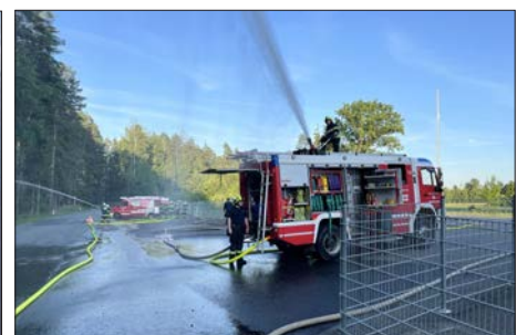
06.07.2021 Vier Feuerwehren üben bei der Fa. TE Connectivity