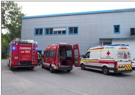
11.06.2021 Verletzter Mitarbeiter nach Schwefelsäureaustritt