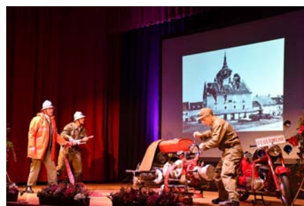
Showeinlage von Feuerwehrmitgliedern

Nach einer kurzweiligen, tollen Show wurde im Anschluss das Buffet eröffnet und damit der gemütliche Teil des Abends eingeläutet. Noch lange wurde gemeinsam mit Kameraden, Freunden, Unterstützern und Partnern dieser besondere Anlass gefeiert.