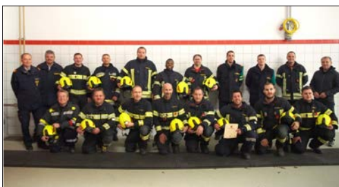
Prüfer und Teilnehmer der Ausbildungsprüfung

Am 14. November 2021 traten zwei Gruppen der Feuerwehr Waidhofen/Thaya zum Bewerb "Technischer Einsatz" in den Stufen Bronze und Gold an. Nach intensiver Vorbereitungsarbeit konnten folgende Feuerwehrkameraden die begehrten Leistungsabzeichen erwerben.