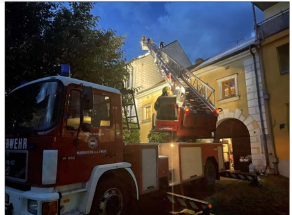
Einsatz nach schweren Hagelunwetter in Allentsteig

Am 24.06.2021 zog ein heftiges Hagelunwetter über das Land und beschädigte unzählige Dächer und Fahrzeuge im Bereich Allentsteig. Um 19:12 Uhr wurde unter anderem die Höhenrettungsgruppe Waidhofen/Thaya und die Drehleiter der Stadtfeuerwehr angefordert. Stark beschädigte Dächer mussten mit Planen abgedeckt werden, damit nicht weiter Wasser in die Wohnhäuser eindringen konnte. Die ausgebildeten Höhenretter wurden mit der Drehleiter auf die Dächer gebracht, sicherten sich mit Spezialausrüstung und begannen mit der Arbeit. Drei Tage lang unterstützten Mitglieder der Feuerwehr Waidhofen/Thaya die Aufräum- und Sicherungsarbeiten in Allentsteig.