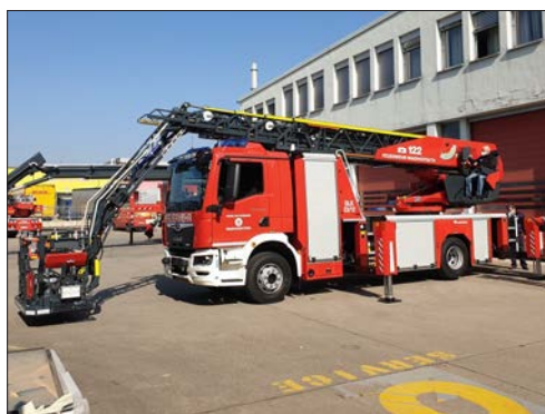
Die neue Drehleiter ist einsatzbereit

Insgesamt sind rund 190 Ausrüstungsgegenstände wie zum Beispiel Absicherungsmaterial, Atemschutzgeräte, elektrischer Druckbelüfter, Großbeleuchtungssystem, Höhensicherungsmaterial, Krankentragehalterung (bis zu 300 kg Nutzlast), Stromerzeuger, Sprungretter, Tablet, Wasserwerfer, Wärmebildkamera, Windmesser und vieles mehr in der Drehleiter zu finden.