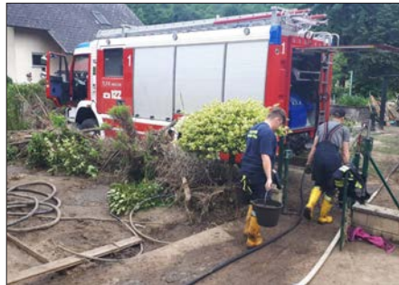
20. und 21.07.2021 Katastrophenhilfsdienst-Einsatz in Aggsbach-Dorf