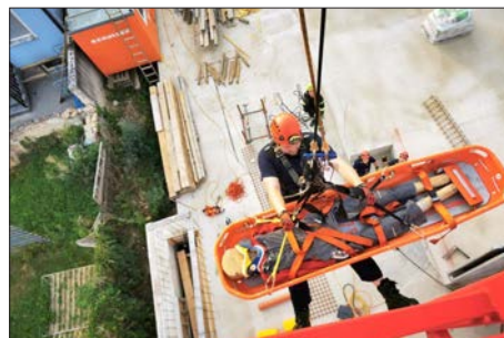
30.07.2021 Höhenrettungsgruppe trainiert in Hollabrunn