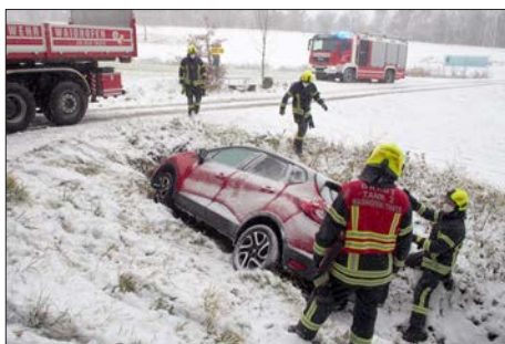
26.11.2021 Wintereinbruch führt zu Fahrzeugbergungen