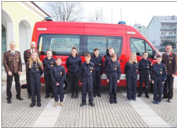
Jugendgruppe bei der Mitgliederversammlung 2022

Mit der Vollendung des zehnten Lebensjahres haben Mädchen und Burschen die Möglichkeit der Feuerwehr beizutreten, wo sie zunächst in der Feuerwehrjugendgruppe von eigens dafür ausgebildeten Jugendbetreuern betreut werden. Frühestens im Alter von fünfzehn Jahren werden sie dann in den Aktivstand der Freiwilligen Feuerwehr überstellt. Erst ab dem Zeitpunkt der Überstellung in den Aktivdienst dürfen die Jugendlichen auch an Einsätzen teilnehmen.