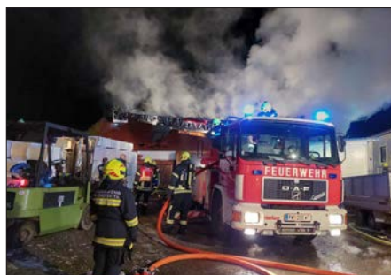
21.12.2021 Werkstätten-Brand in Vitis