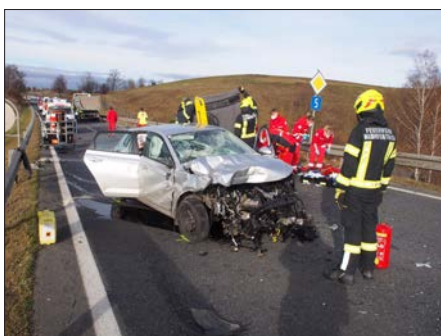
19.11.2021 Drei Fahrzeuge in schweren Unfall verwickelt