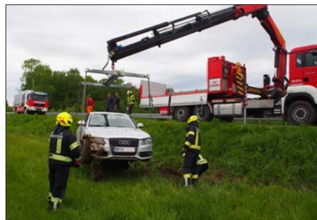
21.05.2021 Straßenüberquerung einer Entenfamilie führte zu Unfall