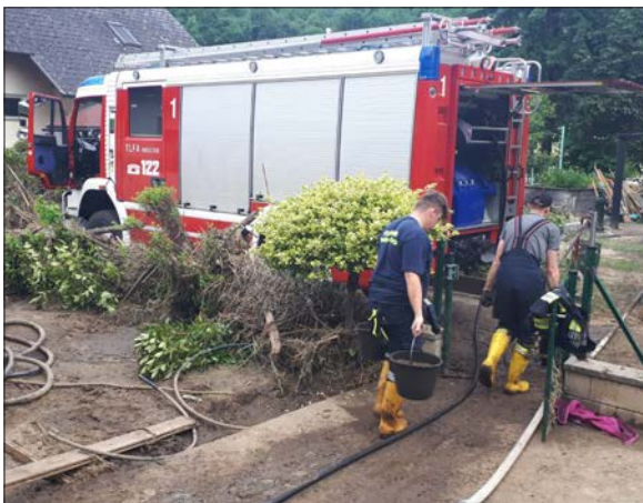
Aufräumarbeiten in Aggsbach-Dorf

Am 20. Juli 2021 rückte ein Zug des Katastrophenhilfsdienstes (KHD) aus dem Bezirk Waidhofen/Thaya in das vom Hochwasser schwer getroffene Aggsbach-Dorf (Bezirk Melk) ab. Mit dabei Einsatzkräfte und Einsatzfahrzeuge der Feuerwehr Waidhofen/Thaya. Es wurden Keller mittels Unterwasserpumpen ausgepumpt und Schmutz bzw. Schlamm händisch ausgeschaufelt. Angeschwemmtes Material wurde mit dem Teelader Heinrichs verfrachtet und damit wieder Zufahrten, Gärten und Verkehrswege freigegeben. Der Einsatz des Wechselladefahrzeuges wurde noch um einen Tag verlängert und die Aufräumarbeiten am 21. Juli weiter unterstützt.