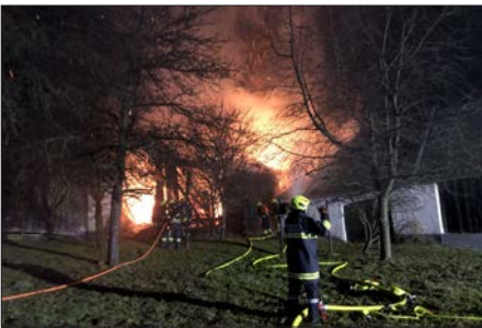
05.03.2021 Sechs Feuerwehren bei Schuppenbrand in Großeberharts