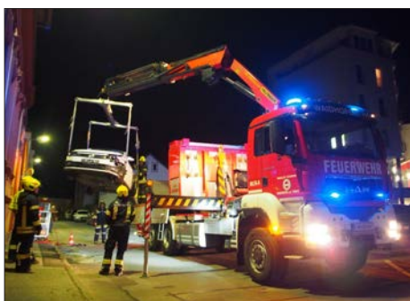
29.10.2021 Während Brandeinsatz Alarmierung zu Verkehrsunfall