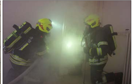
11.05.2021 Realistische Brandeinsatz-Übung in Bürogebäude