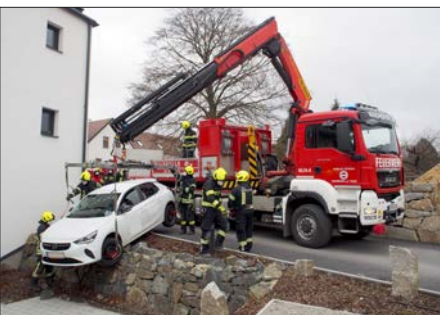
16.04.2021 PKW drohte über Steinmauer zu stürzen