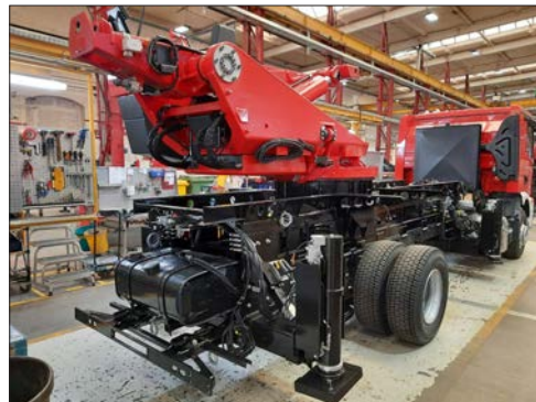
Stand 10. Jänner 2022