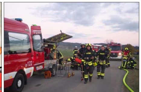
23.10.2021 Großübung in Hollenbach