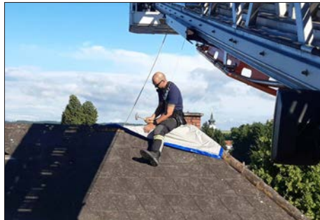
24. - 26.06.2021 Unterstützung nach Hagelunwetter in Allensteig