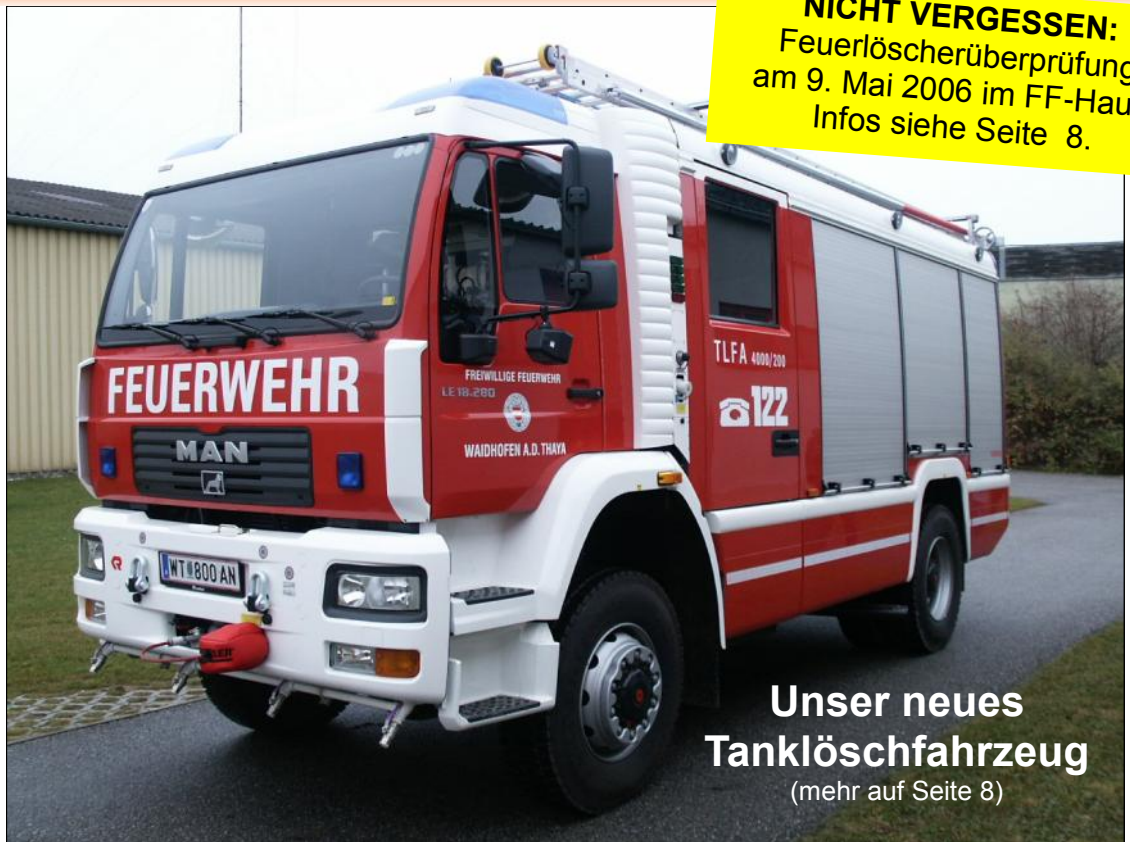
Unser neues Tanklöschfahrzeug (mehr auf Seite 8)