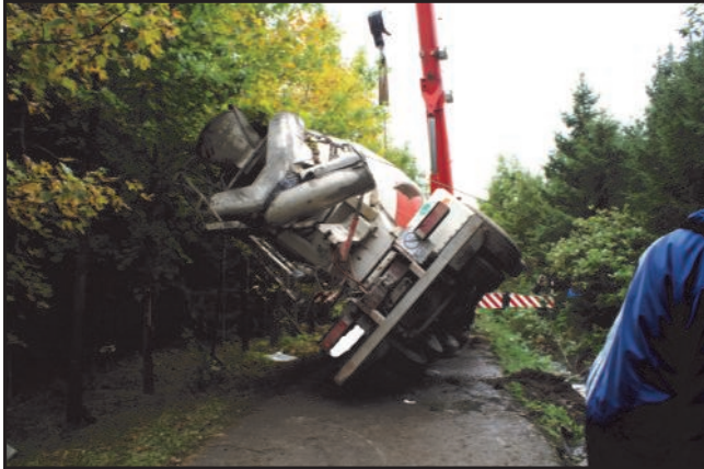
29. September 2010 Umgestürzter 4-Achs Betonmischer