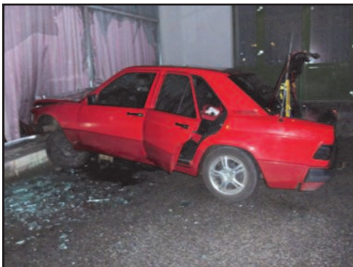
03. August 2010 Auto kracht in die Arbeiterkammer