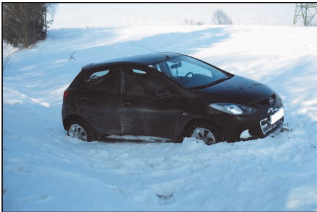
18. Dezember 2010 PKW-Bergung am Wohlfahrtsberg