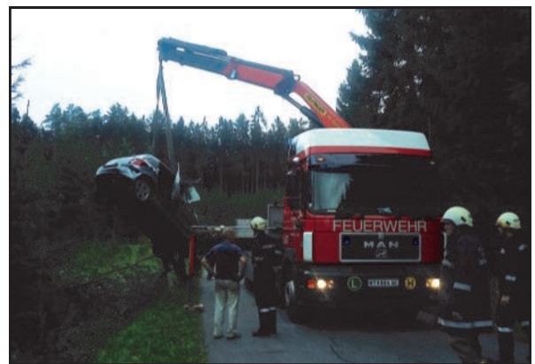
27. Juli 2010 Fahrzeugbergung auf der L 8138