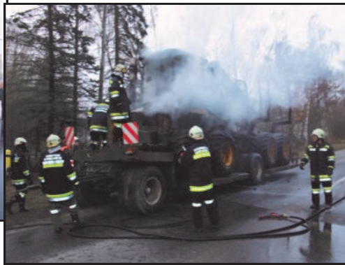
30. März 2010 Fahrzeugbrand auf der LB 36