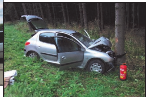
28. September 2010 Verkehrsunfall am Bründlberg

Farben · Raumausstattung · Parkettböden Sonnenschutz · Matratzen Stuckdesign · Fassadengestaltung · Malerei · Computerbeschriftung