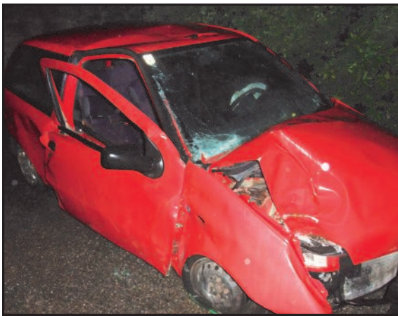
16. Juni 2010 Verkehrsunfall mit Menschenrettung auf der LB 5