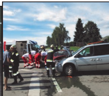
25. August 2010 Verkehrsunfall mit Menschen- rettung