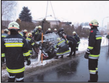
06. März 2010 Verkehrsunfall auf der L 60 bei Matzles