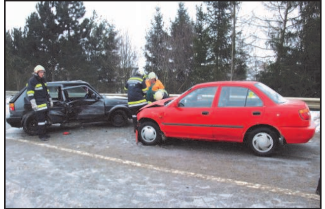
14. Dezember 2010 Verkehrsunfall mit eingeklemmter Person