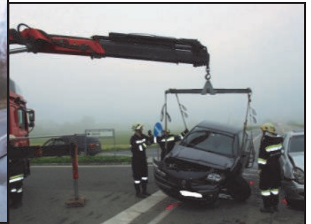
09. Juni 2010 Verkehrsunfall Höhe Bittnerkreuzung