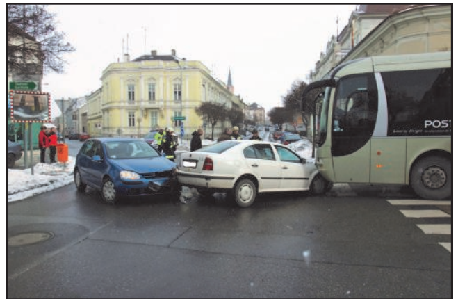
27. Dezember 2010 Verkehrsunfall mit drei beteiligten Fahrzeugen