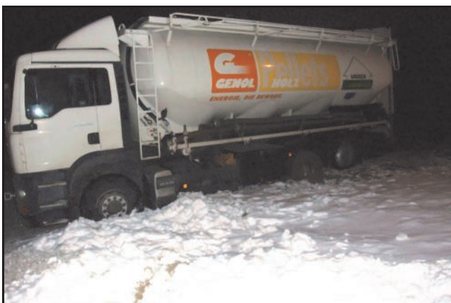
27. Dezember 2010 LKW-Bergung in Buchbach

Feuerlöscherüberprüfung im Feuerwehrhaus Waidhofen/Thaya