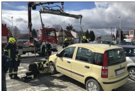
13.03.2018 Erneute Fahrzeugbergung auf einem Parkplatz im Stadtgebiet