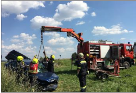
31.07.2018 Zusammenstoß zweier PKW's bei Götzweis