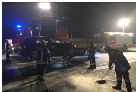
08.11.2018 Verkehrsunfall auf der „Bittnerkreuzung“