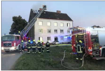
25.09.2018 Großbrand in Dietmanns fordert 16 Feuerwehren