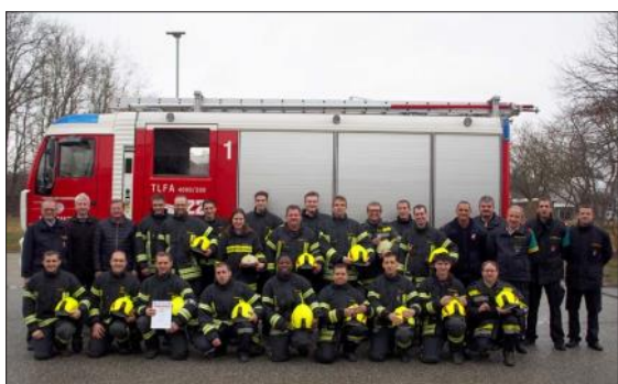
Absolventen der Ausbildungsprüfung „technischer Einsatz“