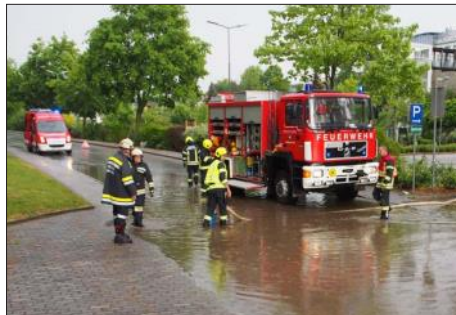
10.05.2018 Unwetterfront zieht über Waidhofen