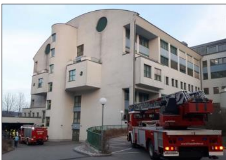
09.04.2018 Brandalarm im Müllraum des Landeskrankenhauses