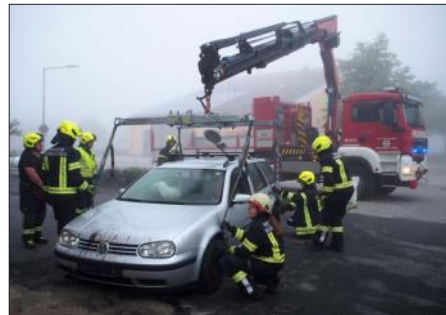
26.05.2018 Auto kracht gegen Verkehrsschild