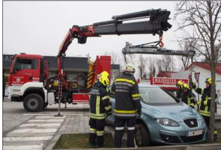
12.01.2018 Typisches Einsatzbild einer Fahrzeugbergung im Stadtgebiet