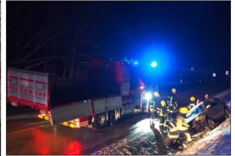
20.02.2018 Fahrzeugbergung aus dem Straßengraben auf der B5