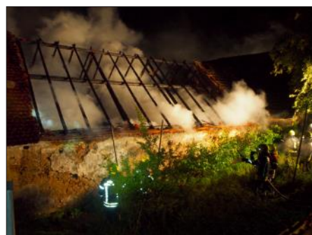
17.06.2018 Elf Feuerwehren bei Scheunenbrand in Groöbeberharts