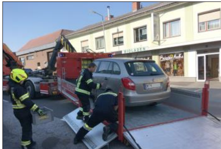
16.10.2018 PKW kracht gegen parkende Autos