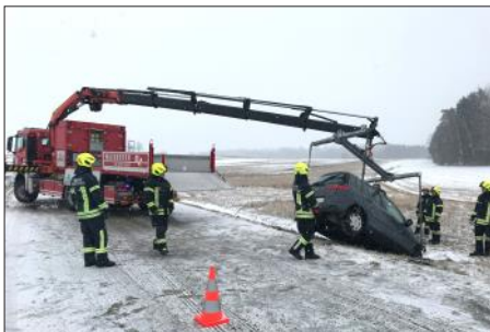
06.03.2018 Unterstützung bei Verkehrsunfall auf der L59