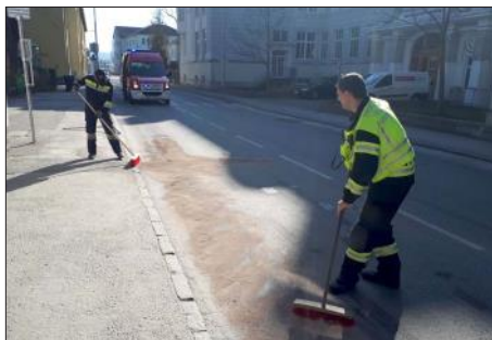
10.04.2018 Autobus zieht kilometerlange Ölspur