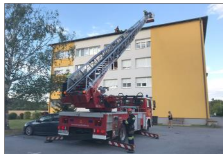
25.07.2018 Windböen reißen Dachlücke aus Verankerung