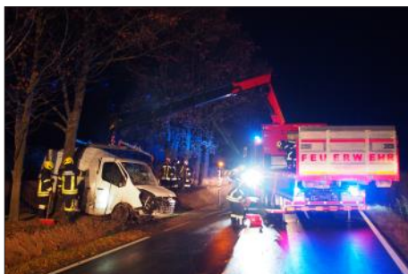
24.10.2018 Kleintransporter kracht Höhe Matzles gegen Baum