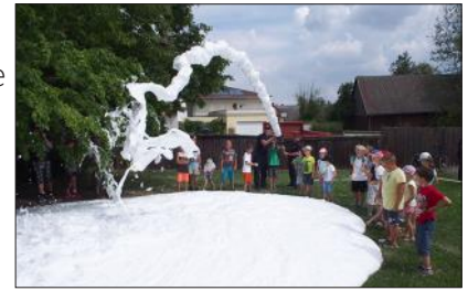
Die Kinder bei der Schaumerzeugung

Am 30. Juli durften rund 30 Kinder im Rahmen des Ferienspiels der Gemeinde Waidhofen/Thaya die Feuerwehr besuchen. Die Kinder erlebten wie es sich anfühlt hinter dem Steuer eines Feuerwehrautos zu sitzen und konnten mit Hilfe der Drehleiter ihren Blick über die Dächer der Stadt schweifen lassen. Der Abschluss dieses sehr heißen Sommertages bildete die Herstellung eines Schaumteppichs, der von einigen auch zur Abkühlung genutzt wurde.