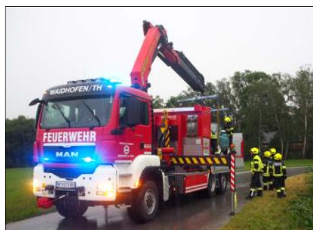
12.06.2018 Fahrzeugbergung auf Güterweg