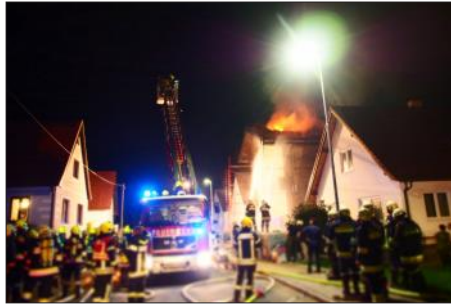
21.09.2018 Unterstützung bei Dachstuhlbrand in Vitis