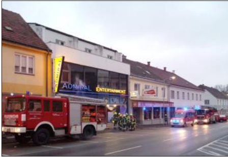
11.01.2018 Gasgeruch im Stadtgebiet

Hier ein Auszug aus dem Einsatztagebuch der Feuerwehr: