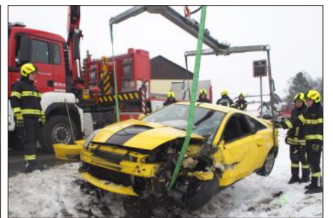
19.12.2018 Zwei Verletzte nach Zusammen- stoß in Nonndorf