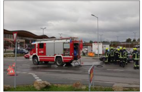
24.09.2018 Fahrzeugbrand im Bereich der Zufahrt zum EKZ Thayapark