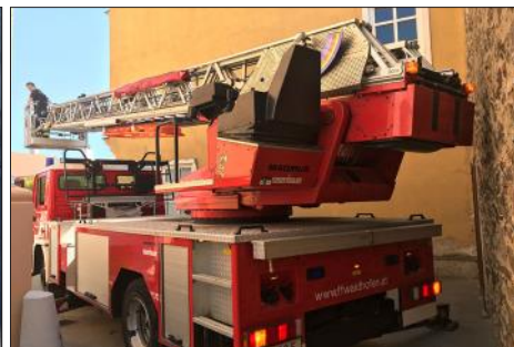
19.04.2018 Sicherungsarbeiten an der Stadtpfarrkirche