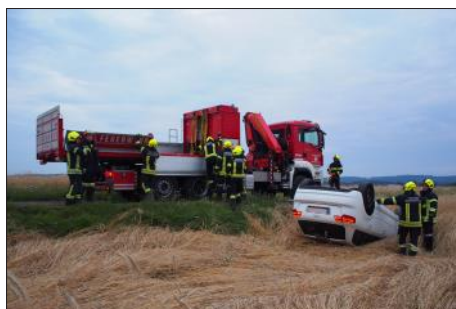
09.07.2018 PKW Überschlag endet im Getreidefeld