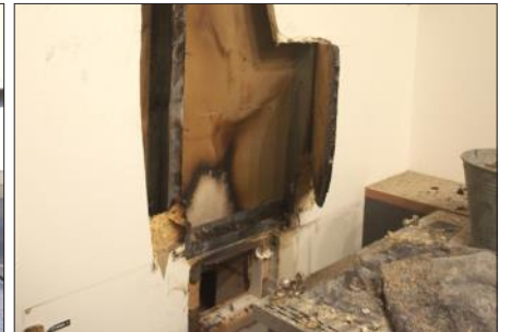
20.10.2018 Brand in Zwischenwand rechtzeitig entdeckt