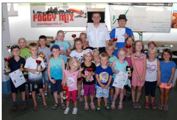
Die Siegerinnen und Sieger des Geschicklichkeitswettbewerbes

WAIDHOFEN/THAYA, TEL 02842 / 52227 - FAX DW 27 eMail: buero@wisgrill.at - www.wisgrill.at