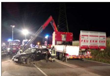
18.06.2018 Nächtlicher Verkehrsunfall auf der B5