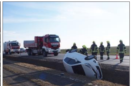
20.03.2018 PKW stürzt auf der B36 in Straßengraben