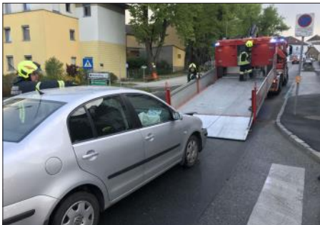
20.04.2018 Verkehrsunfall auf der „Zischka-Kreuzung“