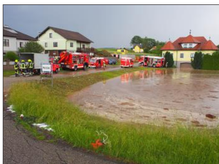
01.06.2018 Erneute Unwetterfront setzt Matzles unter Wasser