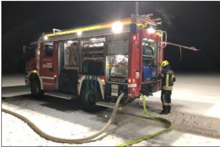
05.02.2019 Aufbau einer Löschleitung bei eisigen Temperaturen

Ohne regelmäßige Übungen könnten die vielen Aufgaben der Freiwilligen Feuerwehr Waidhofen/Thaya nicht so rasch und professionell gelöst werden. Bei 61 Übungen im Jahr 2019 wurden von den Feuerwehrmitgliedern 1.393 Stunden in die Weiterbildung und Festigung ihres Wissens investiert. Hier einige Übungen die im Jahr 2019 durchgeführt wurden: