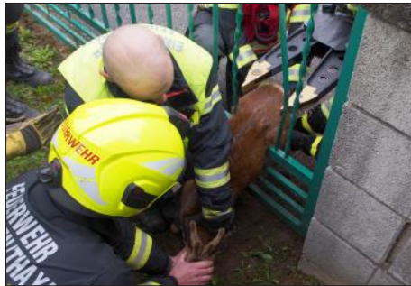
04.05.2019 Tierrettung: Rehbock steckt in Zaun fest