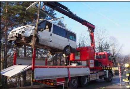
19.02.2019 Kindergartenbus landet nach Kollision im Graben