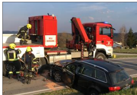
03.04.2019 Unterstützung bei Fahrzeug- bergung Nähe Kottschallings