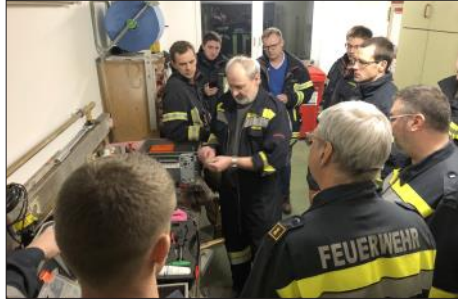
12.02.2019 Schulung für Türöffnungen mit der FF Dietmanns