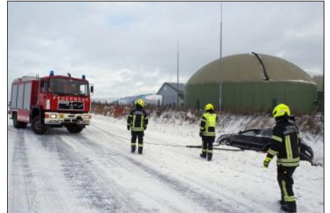
15.01.2019 Fahrzeugbergung aus dem Straßengraben auf der LB36