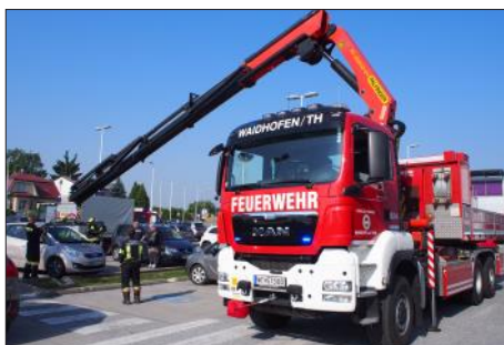
27.06.2019 KFZ-Bergung am Parkplatz einer bekannten Handelsfirma