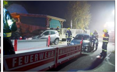
25.10.2019 Nächtliche Fahrzeugbergung im Stadtgebiet