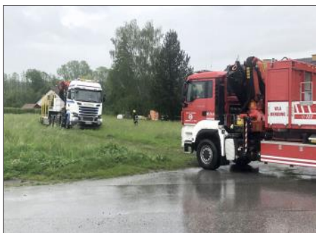
28.05.2019 LKW-Bergung mittels Seilwinde