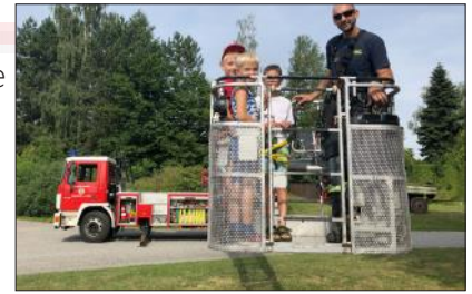
Die Kinder bei der Fahrt mit der Drehleiter

Am 22. Juli durften rund 30 Kinder im Rahmen des Ferienspiels der Gemeinde Waidhofen/Thaya die Feuerwehr besuchen. Die Kinder erlebten wie es sich anfühlt hinter dem Steuer eines Feuerwehrautos zu sitzen und konnten mit Hilfe der Drehleiter ihren Blick über die Dächer der Stadt schweifen lassen. Der Abschluss dieses heißen Sommertages bildete die Herstellung eines Schaumteppichs, der von einigen auch zur Abkühlung genutzt wurde.