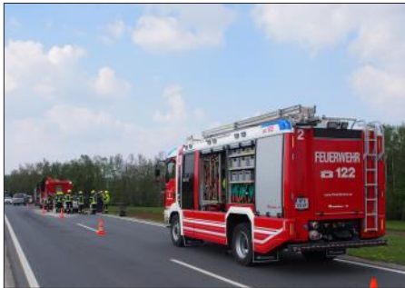
02.05.2019 Auffahrunfall auf der Bundesstraße 36