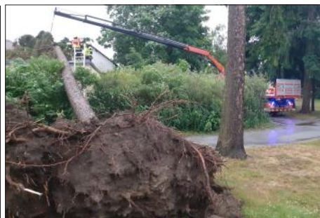
01.07.2019 Eine Unwetterfront zog über die Stadt