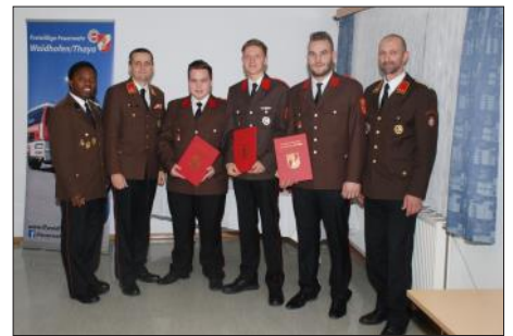
Das Kommando mit den neu angelobten Feuerwehrmitgliedern