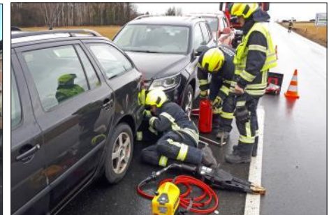
23.12.2019 Auffahrunfall im Weihnachtsstress auf der LB36