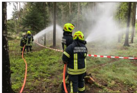
28.04.2019 83 Feuerwehren übten die Waldbrandbekämpfung