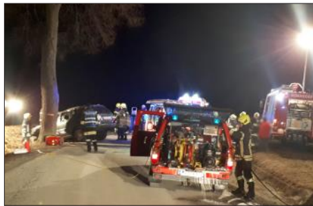
19.02.2019 Fahrzeugüberschlag fordert Verletzten