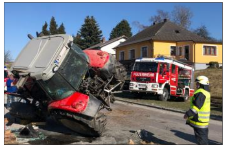
07.03.2019 Umgestürzter Traktor in Pyhra