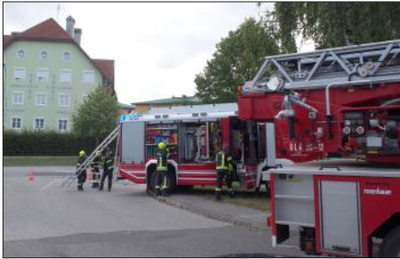
20.08.2019 Medizinischer Notfall erfordert raschen Zutritt zu Wohnung