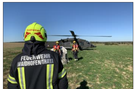
12.10.2019 Flugdienstübung mit Flurbrand- bekämpfung in Allentsteig