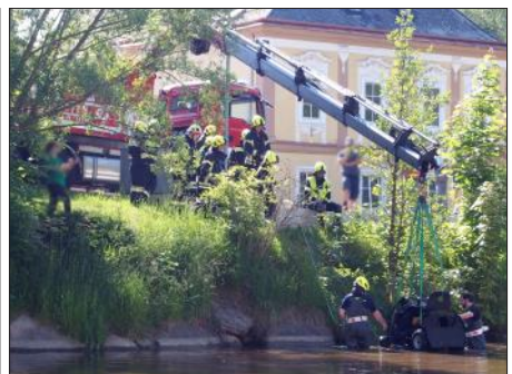
31.05.2019 Aufsitzmäher wurde aus der Thaya geborgen