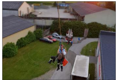
11.06.2019 Höhenrettungsgruppe übt am Funkmast