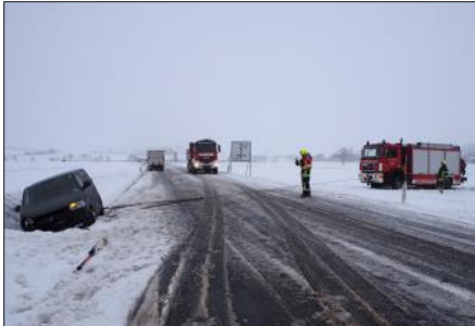
05.01.2019 Unfälle durch starken Schneefall

228 Einsätze wurden im Jahr 2019 von den Mitgliedern der Freiwilligen Feuerwehr Waidhofen/Thaya bewältigt. Egal zu welcher Tages- oder Nachtzeit - die Einsatzkräfte rückten aus und konnten rasch helfen. Insgesamt wurden 1.368 Einsatzstunden von den Florianis geleistet. Hier ein Auszug aus dem Einsatztagebuch der Feuerwehr: