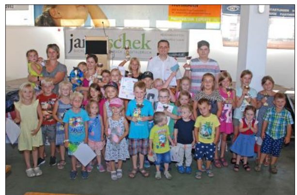
Die Siegerinnen und Sieger des Geschicklichkeitswettbewerbes

WAIDHOFEN/THAYA, TEL 02842 / 52227 - FAX DW 27 eMail: buero@wisgrill.at - www.wisgrill.at