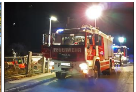
30.11.2019 Kleinbrand auf Baustelle im Stadtgebiet