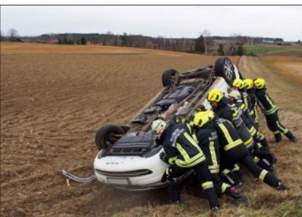
09.03.2019 PKW stürzt über Böschung