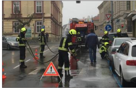
18.10.2019 Auffahrunfall bei der Postkreuzung