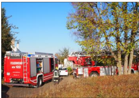
07.11.2019 Türöffnung nach medizinischem Notfall