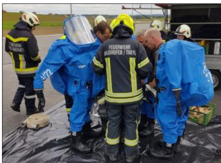
13.05.2019 Einsatz der Schadstoffgruppe nach Ammoniakaustritt