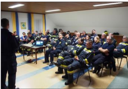
26.03.2019 Gemeinsame Vorbereitung auf Wald- und Flurbrände