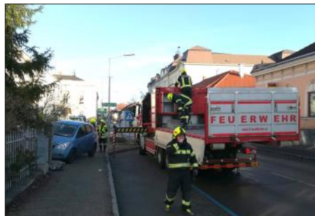
18.12.2019 Fahrzeug kracht in Gartenzaun