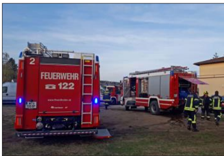
01.11.2019 Brandalarm in Wohnhausanlage durch überhitzten Ofen