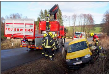
15.12.2019 Fahrzeugbergung nach Unfall bei Götzles