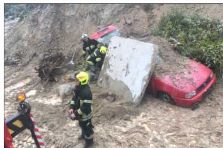
05.10.2019 Katastrophenübung im Steinbruch in Schrems