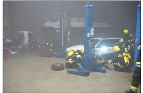
26.02.2019 Branddienstübung im Autohaus Lirnberger