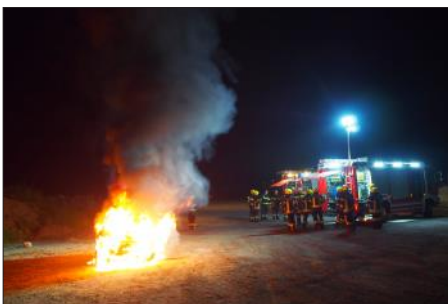
24.09.2019 Fahrzeugbrandbekämpfung mit neuem HLF 2