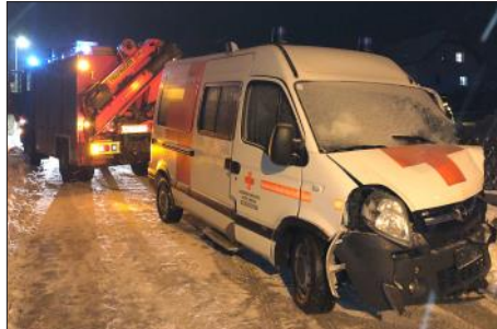
09.01.2019 Zusammenstoß in Dimling