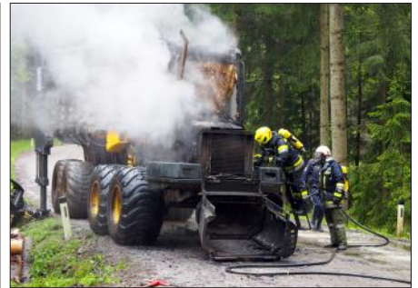
09.05.2019 Forwarder brennt im Wald bei Hollenbach