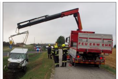
28.07.2019 Kleinbus kam auf der B5 von der Fahrbahn ab