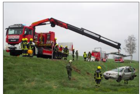
23.04.2019 Unfall mit zwei PKW's auf der L60 Richtung Matzles