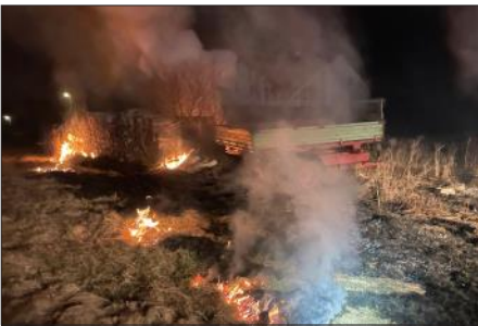
10.03.2022 Heiße Asche löst Flurbrand aus