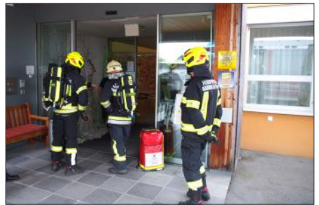
28.04.2022 CO-Alarm im Pflege- und Betreuungszentrum