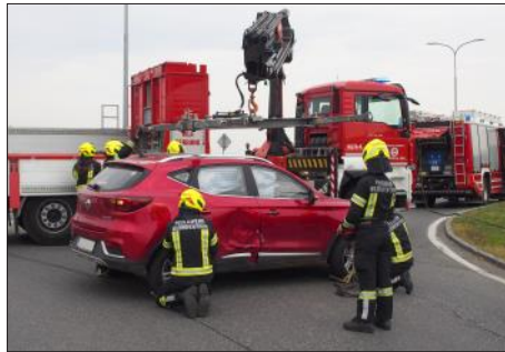
29.07.2022 Zusammenstoß mit Elektrofahrzeug im Kreisverkehr