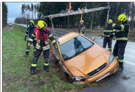
24.11.2022 Unterstützung bei PKW-Bergung auf der B5