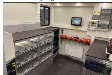
Arbeitsplatz des Füllpersonals

Im Oktober 2022 wurde mit dem Bau des neuen Containers begonnen. Am 7. März 2023 erfolgte, nach positiver technischer Abnahme, die Überstellung des Wechselladeaufbau-Atemluft zur Stationierungsfeuerwehr Waidhofen/Thaya. Der Wechselladeaufbau wird für die Befüllung von Atemluftflaschen (vorzugsweise direkt am Einsatzort) eingesetzt, damit diese so rasch wie möglich wieder für einen neuerlichen Einsatz zur Verfügung stehen. Einsatzgebiet ist hauptsächlich der Feuerwehrabschnitt Waidhofen/Thaya bzw. bei größeren Einsätzen natürlich auch über diese Grenzen hinaus. Heckseitig wurde ein Atemluftkompressor mit einem Betriebsdruck von 420 bar und einer Luftlieferungsmenge von 420L/min. eingebaut. Gleich dahinter sind 6 Stk. 50L-Speicherflaschen mit einem Betriebsdruck von 420 bar zu finden. Das Stromaggregat der Marke Himoinisa in schallisolierter Ausführung mit einer Dauerleistung von 34 kVA ist ebenfalls im Heckbereich zu finden. Zum Befüllen der leeren Atemluftflaschen wird die Füllleiste im Inneren verwendet, welche über drei Anschlüsse für 200 bar und drei Anschlüsse für 300 bar Atemluftflaschen verfügt.