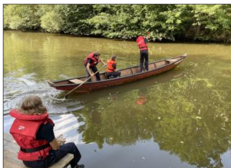
Fertigungsabzeichen „Sicher zu Wasser und zu Land“

Zahlreiche Aktivitäten wurden im letzten Jahr vom Betreuersteam vorbereitet und gemeinsam mit den Jugendlichen absolviert. Neben der feuerwehrfachlichen Ausbildung absolvierten die Jugendlichen erfolgreich ihren ersten Wissenstest und Fertigungsabzeichen. Aber auch die Teilnahme am Bezirksfeuerwehrjugend-Leistungsbewerb in Groß Siegharts samt Lagerleben war ein Erlebnis für alle Beteiligten. Zwischendurch gab es viele lustige Aktivitäten und interessante Ausflüge. Ende August wurde das 1. Feuerwehrjugendjahr mit der Absolvierung des Fertigungsabzeichen und einer Abschlussfeier samt Übernachtung im Feuerwehrhaus abgeschlossen. Im September gab es eine Pause, damit sich die Jugendlichen voll auf den Schulstart konzentrieren konnten.