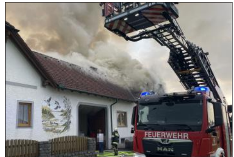
20.06.2022 13 Feuerwehren bei Großbrand in Brunn