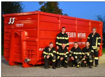
Mitglieder der Arbeitsgruppe vor dem „neuen“ Container

Im Februar 2022 wurde ein gebrauchter Wechselladeaufbau in den Bestand der Feuerwehr übernommen und in rund 850 Arbeitsstunden durch Feuerwehrmitglieder auf die eigenen Anforderungen adaptiert. Der wasserdichte Container wurde so umgebaut, dass er einerseits als Löschwasser-Puffer mit einem Fassungsvermögen von 30 m 3 zur Verfügung steht, andererseits auch Elektrofahrzeuge im Falle eines Brandes eingetaucht werden können. Im Anschluss an diese Arbeiten wurde der komplette Container sandgestrahlt, grundiert und "feuerwehrrrot" lackiert. Im Oktober konnte mit der Beschriftung des Containers der letzte Arbeitsschritt abgeschlossen und der Wechselladeaufbau-Mulde 2 in den Dienst gestellt werden.