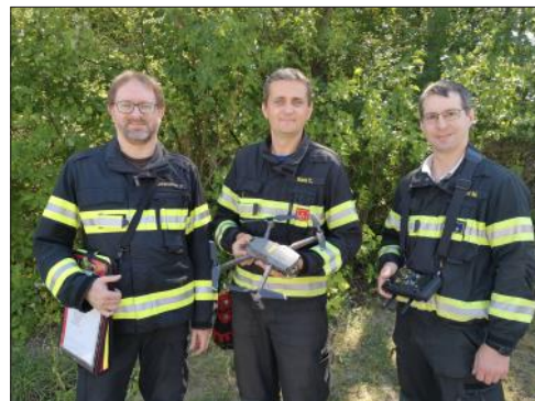
Indienststellung der neuen Drohne

Wie mit jeder Feuerwehrausrüstung muss auch mit diesem Spezial-equipment regelmäßig geübt werden, damit die Drohne zu jeder Tages- und Nachtzeit sicher eingesetzt werden kann. Dazu werden regelmäßig Übungen und auch Zusatzausbildungen absolviert, um dies sicherstellen zu können.