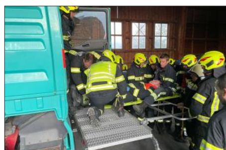
17.05.2022 Personenrettung aus LKW