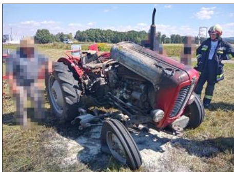
17.08.2022 Traktorbrand gegenüber Fernheizwerk