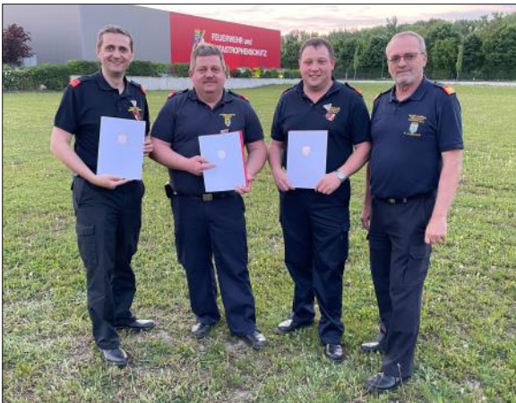
Übergabe der Auszeichnungen für Auslandseinsatz in Nordmazedonien