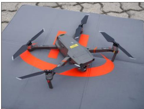
DJI Mavic 2 Enterprise Advanced

auch Live-Bilder für eine raschere Lagebeurteilung herangezogen werden. Das Einsatzspektrum der Drohne erweitert sich mit der zusätzlich verbauten Wärmebildkamera um ein Vielfaches. So können damit zB nicht nur Tier- und Menschenrettungen unterstützt werden, sondern auch im Brandeinsatz Glutnester oder ähnliches rasch lokalisiert werden.