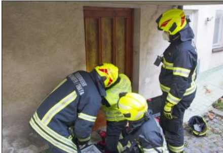
06.01.2022 Gestürzte Person hinter verschlossener Tür

197 Einsätze wurden im Jahr 2022 von den Mitgliedern der Freiwilligen Feuerwehr Waidhofen/Thaya bewältigt. Egal zu welcher Tages- oder Nachtzeit - die Einsatzkräfte rückten aus und konnten rasch helfen. Insgesamt wurden 1.306 Einsatzstunden von den Mitgliedern geleistet. Hier ein Auszug aus dem Einsatztagebuch der Feuerwehr: