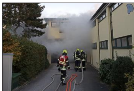
04.10.2022 Einsatzübung im Kolping- Wohnhaus