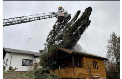
17.02.2022 Baum stürzt bei Sturm auf Gartenhaus