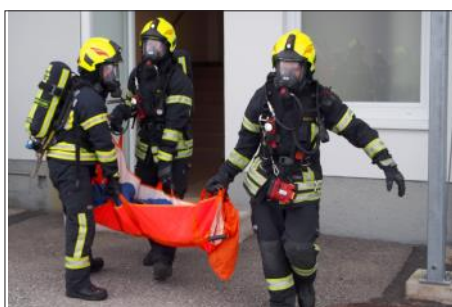
09.09.2022 Gemeinsame Übung mit Schad- stoffgruppe