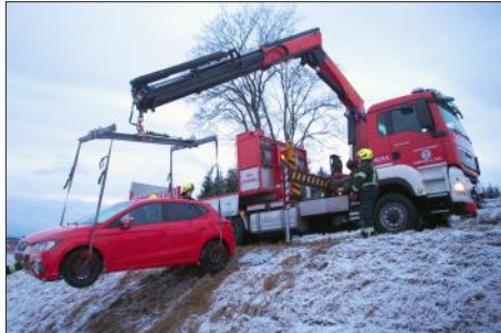
07.02.2022 Bremsmanöver endet im Straßengraben