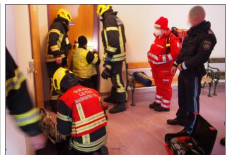
13.12.2022 Polizei fordert Feuerwehr zur Türöffnung an