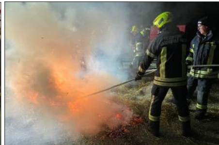
15.03.2022 Flurbrandbekämpfung praktisch geübt