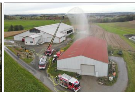
22.10.2022 Gemeindeübung in Ulrichschlag