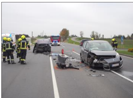
13.10.2022 Fahrzeugbergung nach Verkehrs- unfall auf der B5