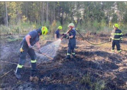
10.05.2022 Acht Feuerwehren bei Flurbrand in Kaltenbach