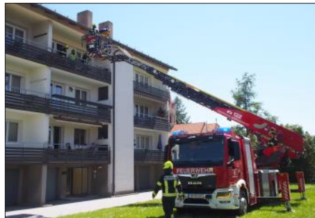
19.05.2022 Personenrettung aus 3. Obergeschoß mit Drehleiter