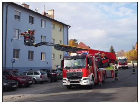
18.10.2022 Unterstützung Rettungsdienst mit Drehleiter