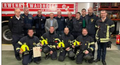
Prüfer und Teilnehmer der Ausbildungsprüfung

Am 4. November 2022 stellte sich eine Gruppe der Feuerwehr Waidhofen/Thaya der Ausbildungsprüfung "Atemschutz" in der Stufe Gold. Nach intensiver Vorbereitungsarbeit konnten folgende Feuerwehrkameraden die begehrten Leistungsabzeichen erwerben: