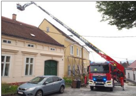
29.06.2022 Sicherungsarbeiten auf Dach nach Sturm