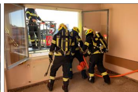
12.07.2022 Leerstehendes Wohngebäude als Übungsobjekt