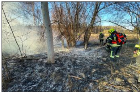
22.03.2022 Rasche Brandausbreitung bei Flurbrand