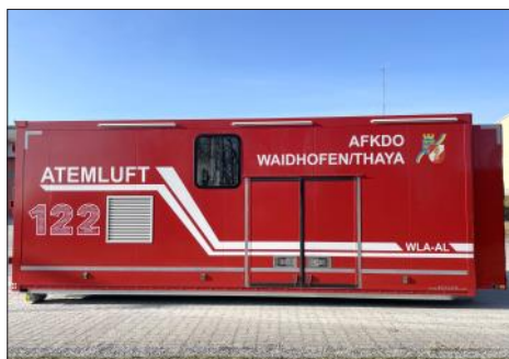
Der neue Wechselladeaufbau-Atemluft

Im Jahr 2021 wurde im Auftrag des Abschnittsfeuerwehrkommandos Waidhofen/Thaya eine Arbeitsgruppe gebildet, um ein Nachfolgeprodukt für den seit 2002 im Einsatz stehenden Atemluftanhänger zu finden. Es wurde der Entschluss gefasst, dass ein Wechselladeaufbau-Atemluft der Nachfolger des derzeitigen Atemluftanhängers werden soll.