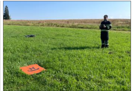
31.07.2022 Drohngengruppe unterstützt Tier- suche im Radlbachwald