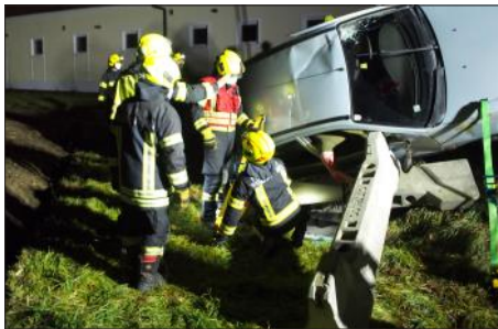
04.01.2022 Menschenrettung aus PKW

Ohne regelmäßige Übungen könnten die vielen Aufgaben der Freiwilligen Feuerwehr Waidhofen/Thaya nicht so rasch und professionell gelöst werden. Bei 91 Übungen im Jahr 2022 wurden von den Feuerwehrmitgliedern 1.336 Stunden in die Weiterbildung und Festigung ihres Wissens investiert. Hier einige Übungen die im Jahr 2022 absolviert wurden: