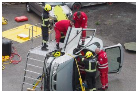
07.05.2022 Ausbildungsnachmittag für Notfallsanitäter