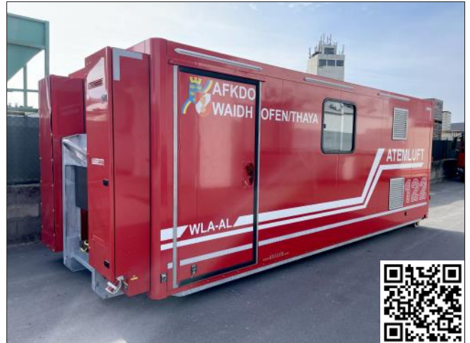
Der neue Wechselladeaufbau-Atemluft

Bereits im Jahr 2021 wurde im Auftrag des Abschnittsfeuerwehrkommandos Waidhofen/Thaya eine Arbeitsgruppe gebildet (darunter zwei Mitglieder der Feuerwehr Waidhofen/Thaya), um ein Nachfolgeprodukt für den seit 2002 im Einsatz stehenden Atemluftanhänger zu finden. In zahlreichen Arbeitsgruppen-Sitzungen wurden die Ansprüche und Anforderungen an das neue Produkt gemeinsam erarbeitet, Informationen über aktuelle Produkte und in Folge Angebote verschiedener Firmen eingeholt. Mit der Stationierung des Containers bei der Feuerwehr Waidhofen/Thaya ist eine große Verantwortung, viel Betreuungszeit und hoher Ausbildungsaufwand verbunden.