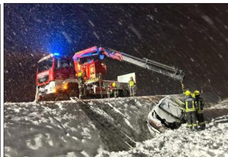
01.12.2023 Zahlreiche Einsätze aufgrund starker Schneefälle