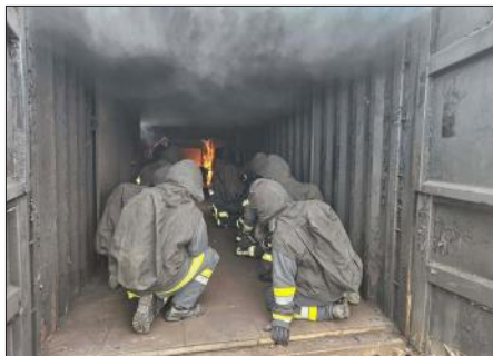
Wärmegewöhnung mit umluftunabhängigen Atemschutz

Die Atemschutzgeräteträger der Feuerwehr durchlaufen im Zuge ihrer Ausbildung einen Stufenplan, um optimal für den Ernstfall vorbereitet zu sein. So besuchten zahlreiche Mitglieder der Feuerwehr Waidhofen/Thaya in den letzten Jahren die Stufe 4 der Atemschutzausbildung "Wärmegewöhnungsanlage gasbefeuert", welche vom NÖ Landesfeuerwehrverband organisiert wurde. Im Vorjahr ging es für einige Atemschutzgeräteträger weiter in der Stufenausbildung.