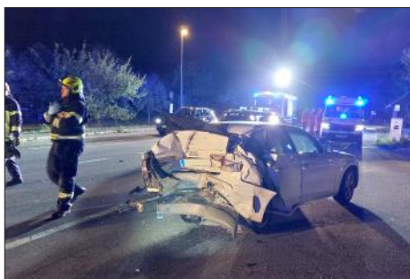
07.10.2023 Todesopfer nach Auffahrunfall