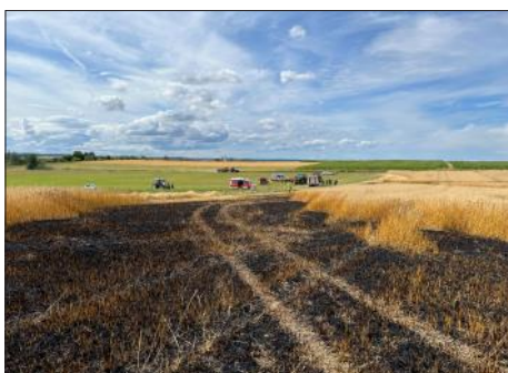
29.07.2023 Fünf Feuerwehren bei Getreidefeld-Brand