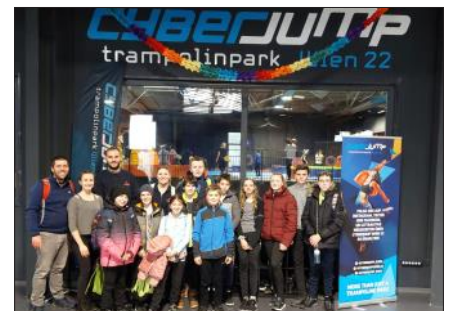
Ausflug in die Trampolinhalle