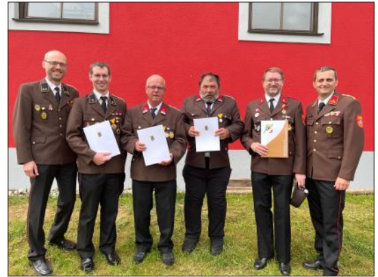
Ehrungen langjähriger Feuerwehrmitglieder