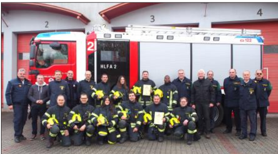
Teilnehmer, Prüfer und Ehrengäste der Ausbildungsprüfung Löscheinsatz

Am 19. November 2023 stellten sich zwei Gruppen der Feuerwehr Waidhofen/Thaya der Ausbildungsprüfung "Löscheinsatz" in der Stufe Bronze und Gold. Nach intensiver Vorbereitungsarbeit konnten folgende Feuerwehrkameraden die begehrten Leistungsabzeichen erwerben: