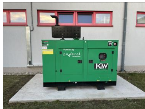
50 kVA Notstromaggregat für das FF-Haus

Bisher konnte das Feuerwehrhaus bei Stromausfall nur über eines der drei 14 kVA-Stromaggregate (welche in Einsatzfahrzeugen gehalten sind) mit Strom versorgt werden. Dafür mussten Checklisten abgearbeitet werden, um verschiedene Verbraucher vor Inbetriebnahme des Notstrombetriebes abzuschalten. Im Zuge einer Förderungsaktion des NÖ Landesfeuerwehrverbandes wurde