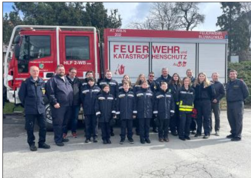
Wissenstest in Nonndorf erfolgreich absolviert

Das Jahr 2023 war erneut ein sehr erfolgreiches für die Feuerwehrjugendgruppe. Mittlerweile ist die Gruppe auf 15 Mitglieder angewachsen. Die Jugendgruppe hat zahlreiche Aktivitäten mit dem Betreuersteam im Vorjahr absolviert.