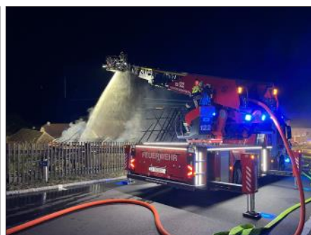
12.09.2023 Drehleiter bei Scheunenbrand im Einsatz