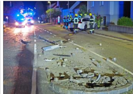
23.07.2023 PKW mährt Verkehrsinsel und Straßenlaterne nieder