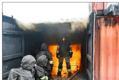
Einmarschieren ins „Feuer“

den Feuerwehrmitgliedern alles Wichtige über Brandverlauf und Rauchdurchzündung nähergebracht. Zum Abschluss des ersten Tages stand das zentrale Thema "Strahlrohrtechniken" am Ausbildungsplan. Am zweiten Tag ging es heiß her. Insgesamt vier schweißtreibende Durchgänge mussten absolviert werden, bei denen die Teilnehmer teilweise selbst am Strahlrohr tätig waren und so das Erlernte sofort in der Praxis umsetzen konnten. Die drei Mitglieder der Feuerwehr Waidhofen/Thaya konnten viel Wissen vom Kurs mitnehmen und werden dieses erlernte Wissen feuerwehrintern an die Mannschaft weitergeben.