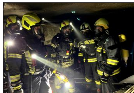
17.12.2023 Drei Feuerwehren bei Kellerbrand in Einfamilienhaus