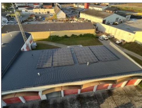
132 PV-Module am Dach der Fahrzeughalle

durch die Stadtgemeinde Waidhofen/Thaya, mit hohem finanziellen Anteil durch die Feuerwehr, ein 50 kVA Notstromaggregat für das Feuerwehrhaus angekauft. Dieses Aggregat verfügt über eine automatische Start- und Stoppfunktion inkl. 200 Liter Dieseltank und versorgt das komplette Feuerwehrhaus bei Stromausfall mit Strom. Damit ist eine fast unterbrechungsfreie Versorgung des Feuerwehrhauses und damit die jederzeitige Einsatzbereitschaft der Feuerwehr gewährleistet.