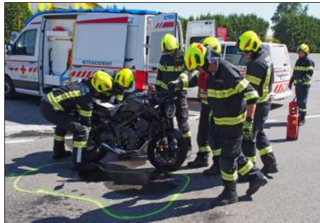
15.07.2023 Schwerer Motorradunfall auf der Bundesstraße 5