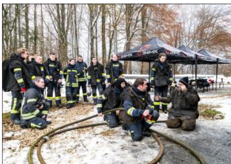
Strahlrohrtraining für die Teilnehmer

Diese Art der Ausbildung ist für die Teilnehmer körperlich sehr fordernd, aber auch sehr lehrreich. Mit diesem Wissen und den gesammelten Erfahrungswerten sind die Absolventen dieser Heißausbildung für zukünftige Atemschutzzeinsätze bestens vorbereitet.