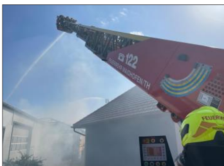
24.08.2023 Unterstützung mit Drehleiter bei Großbrand im Nachbarbezirk