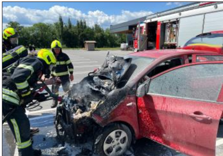
28.06.2023 Fahrzeugbrand am Baumarkt- Parkplatz