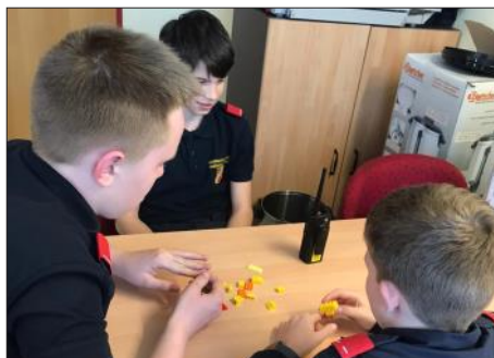
Spielerisches Erarbeiten von Feuerwehrwissen

Du bist zwischen 10 und 15 Jahre und willst bei der Feuerwehrjugend mitmachen? Dann einfach unter 02842/52222-22 anrufen und unverbindlich bei der nächsten Jugendstunde mitmachen.